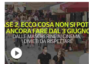
Fase 2, i divieti da rispettare: ecco cosa non si potrà anco...