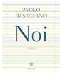
Paolo Di Stefano, «Noi» (Bompiani, pp. 595, euro 22)

pagine a una poesia, come un piccolo intervallo musicale». Di Noi , un viaggio intorno al padre e non solo, un po' autobiografia, un po' epopea familiare, lo stesso Paolo Di Stefano parlerà giovedì 4 giugno nel corso di una presentazione organizzata dal Circolo dei lettori di Milano, dal titolo Raccontare la famiglia .