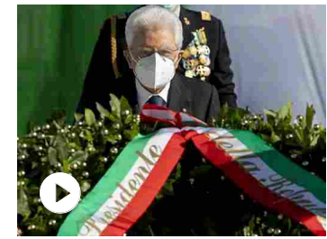
2 giugno, il Presidente della Repubblica Mattarella in visita...