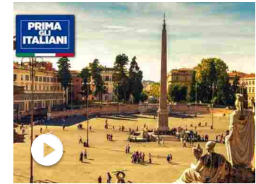
A Roma e Milano la manifestazione del centrodestra «L'Italia...