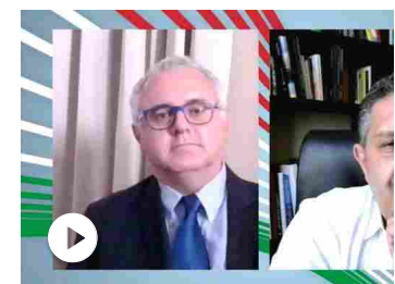
L'Economia d'Italia: ripartire, dalle imprese - il modello G...